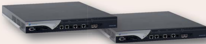
Die zentrale Intelligenz der hochverfügbaren Speicherlösung stellen die beiden gespiegelten SANRAD 3400 Switches dar