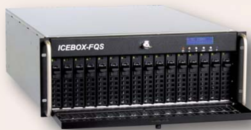
Leistungsfähig & preiswert: Auf zwei ICEBOX-FQS Systemen von N-TEC werden die Daten zentral abgelegt

Den Kern der SAN-Lösung machen die beiden RAID-Systeme vom Modell ICEBOX FQS aus. Diese fassen 16 SAS-Festplatten mit je 147 GByte und verfügen über zwei 4-Gbit/s-FC-Schnittstellen, welche die redundanten Datenpfade zulassen. Die performanten SAS-Platten und die Intel »XScale 64-Bit RISC«-Microprozessoren sorgen dafür, dass die I/O-Last der virtualisierten Server